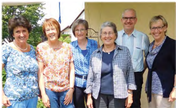
Treffen des Kernteams