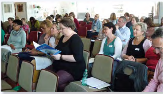
Einführungsseminar in Aichach