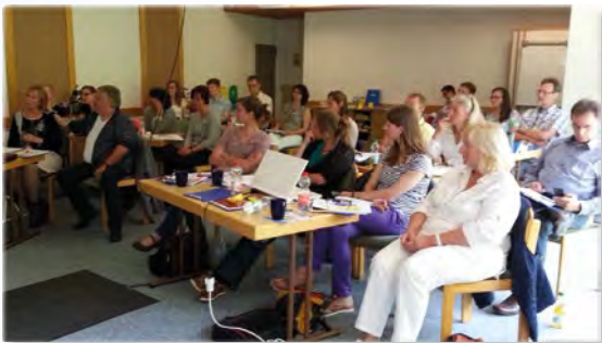
Einführungsseminar in Rettenbach