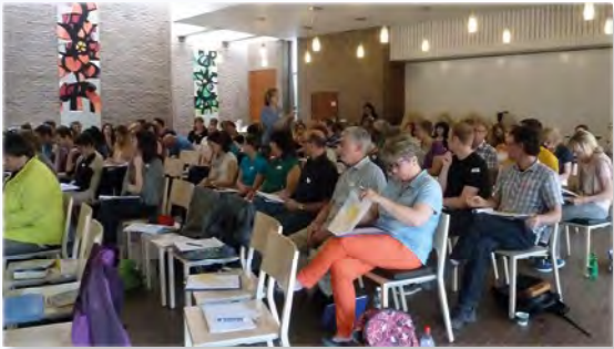
Einführungsseminar in Winterthur