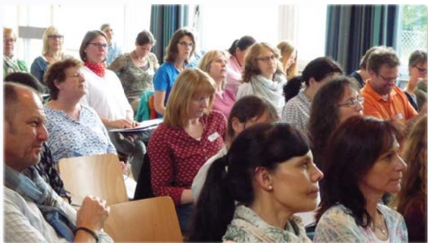
G9-Seminar in Ulm

Viele Teilnehmer schätzen unsere Ausbildung im Baukastensystem sehr. So können sie die Ausbildung ihren persönlichen Zeitfenstern anpassen, die Ihnen ihre Verantwortungen in Beruf, Familie, Gemeinde und den Herausforderungen im Alltag ermöglicht. Wenn sie ein Seminar in einer Region nicht besuchen können, gibt es innerhalb eines Jahres die Möglichkeit, dieses an einem anderen Ort zu belegen. Diesem Bedürfnis wollen wir zum 1. Januar 2017 die Abschlusskriterien des BS anpassen. Die geforderten Abschlusselemente können dann über einen etwas längeren Zeitraum verteilt einzeln abgeschlossen werden. Das wird manchem Studenten, der sich nebenberuflich in diese Ausbildung investiert, den Weg zum Abschluss erleichtern. Bei Interesse finden Sie ab dem 20. Oktober die ergänzten Infos und den leicht korrigierten Antrag zum BS auf unserer Homepage abrufbereit.