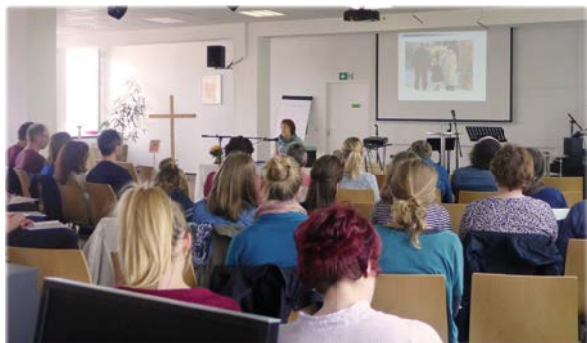
Einführungsseminar in Nürnberg