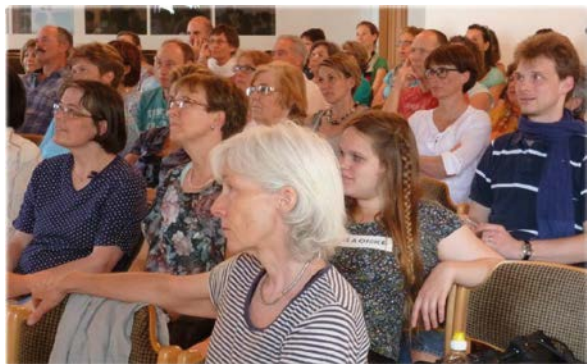
Einführungsseminar in Chur

„Heut‘, werden wir Gottes Wunder sehn, weil wir im Glauben IHN verstehn‘! Heut‘ werden wir Gottes Wunder sehn‘, weil er’s verheißen hat.“