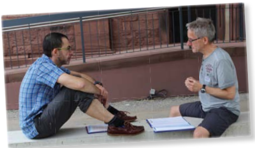
Üben beim Einführungsseminar in Linkenheim-Hochstetten