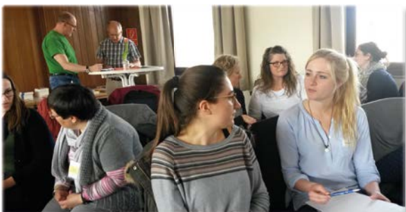
Üben beim Einführungsseminar in Köln