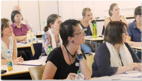
Einführungsseminar in Ruit

Urheberrechte: 1976 SCM Hänsler, 71087 Holzgerlingen