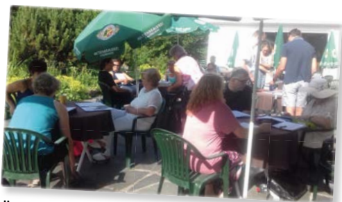
Üben beim G8-Seminar in Rettenbach